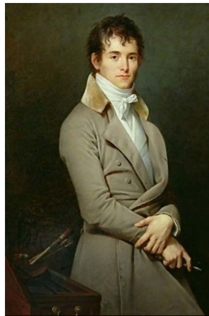
1801, Retrao de Paulin Guérin, por Robert-Jacques-Francois-Faust Lefèvre

Lord George Bryan Brummel, fue símbolo de la elegancia masculina de la época y árbitro de la sociedad. Enseñó el arte de anudar la corbata, la sobriedad, el uso del color negro y que la elegancia no está en el adorno sino en el corte de la ropa. Decía que en un buen guardarropas masculino, el número de chalecos debía duplicar el número de chaquetas y éste, ser triplicado por el número de corbata.