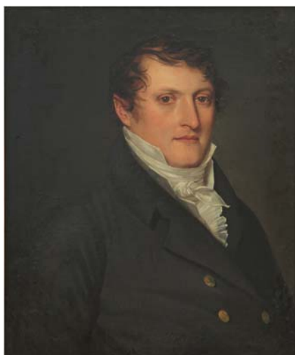
Retrato Del Gral. Manuel Belgrano – Carbonnier, Francois-Casimir N° Inv. 2778 MNBA

El hombre usa patillas y cabello arreglado en colocando las punts sobre la frente y los laterales del rostro, siguiendo el estilo que se observa en los bustos de los emperadores romanos, bajo influencia del Neoclásico, predominante en la última parte del siglo XVIII y que Napoleón Bonaparte favorece.