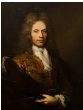
Retrato de caballero francés Por Hiacynth Rigaud y Ros

Óleo sobre tela Escuela austriaca MNAD 3602