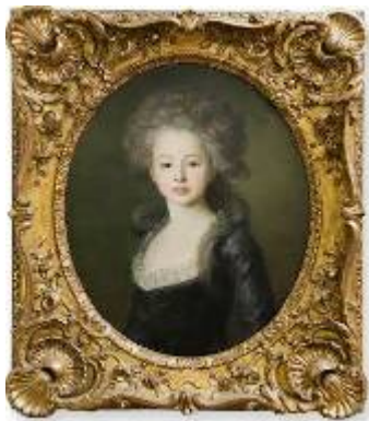
Niña de la Familia Stroganov Por Antoine Vestier