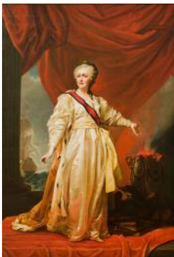
Catalina, la Grande Por Dimitri Levitzki

Óleo sobre tela Escuela austriaca MNAD 3603