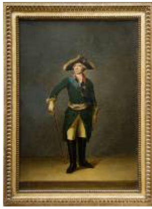
Pablo I de Rusia