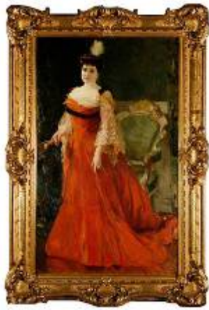
Josefina de Alvear Por Joaquín Sorolla y Bastida

Óleo sobre tela Firmado y fechado 1905 Escuela española Donación Matías Errázuriz Ortúzar, 1937 MNAD 315