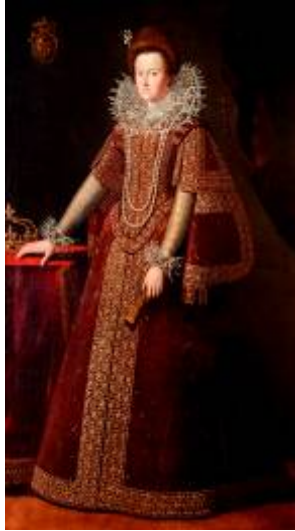
María de Medicis Por Alfonso Sánchez Coello

Óleo sobre tela España Siglo XVI MNAD 336