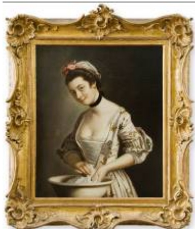
La lavandera Por Henry Robert Morland

Óleo sobre papel Argentina Año 1825 MNAD 1542