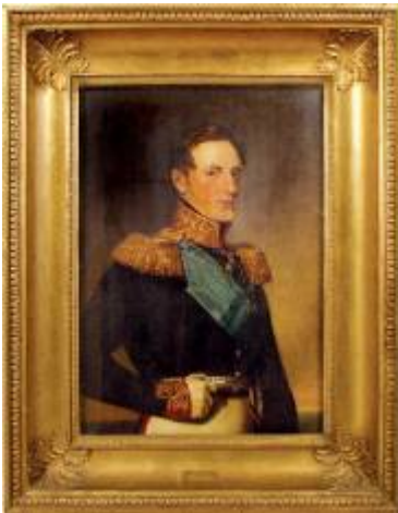
Nicolás I de Rusia Por George Dawe

Óleo sobre tela España Siglo XVI MNAD 336