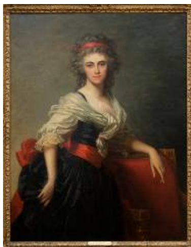
Lady Boyd Por Jean Laurent Mosnier

Óleo sobre tela Inglaterra, siglo XVIII MNAD 3610