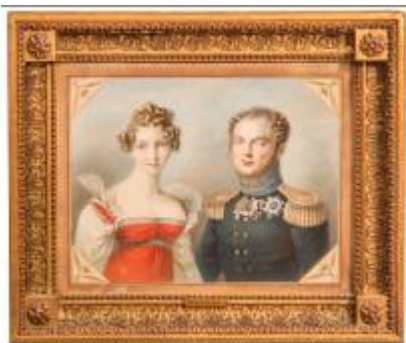
Alejandro I de Rusia y su esposa Elizabeth Por Carl Agricola

Óleo sobre tela Escuela francesa MNAD 4156