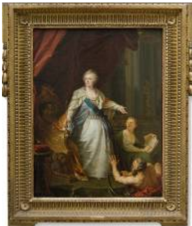
Catalina en el trono con alegorías Por Giovanni Battista Lampi

Óleo sobre tela Escuela francesa, principios sigloXX Donación Arturo Z. Paz Anchorena y Magdalena Paz Anchorena de Duggan, 1998 MNAD 4156