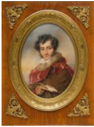
Charles-Victor Prévot, vicomte d'Alincourt Por Jean Baptiste Isabey

Acuarela sobre papel Francia, 1824 MNAD 3510