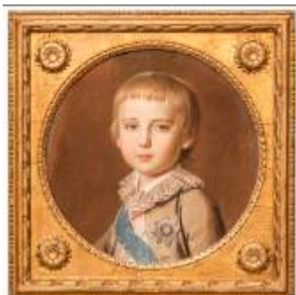
Alejandro Pavlovich Romanov Futuro Alejandro I

Dibujo acuarelado sobre cartón Escuela austriaca MNAD 3584