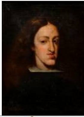
Carlos II de España Por Juan Carreño de Miranda

Óleo sobre tela Escuela española siglo XVII Ex Colección Errázuriz Alvear MNAD 317