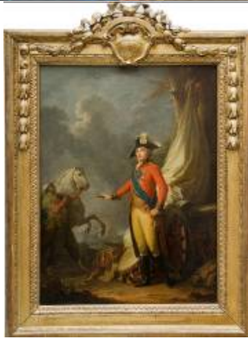
Príncipe Platón Zubov Por Giovanni B. Lampi

Acuarela y aguada sobre marfil Rusia Siglo XVIII MNAD 3516