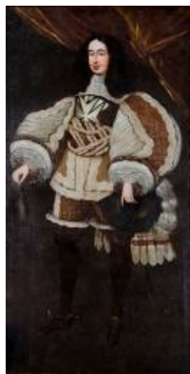
Don Juan de Austria (hijo de Felipe IV) Anónimo

Óleo sobre tela Escuela española S.XVII Ex Colección Errázuriz MNAD 346