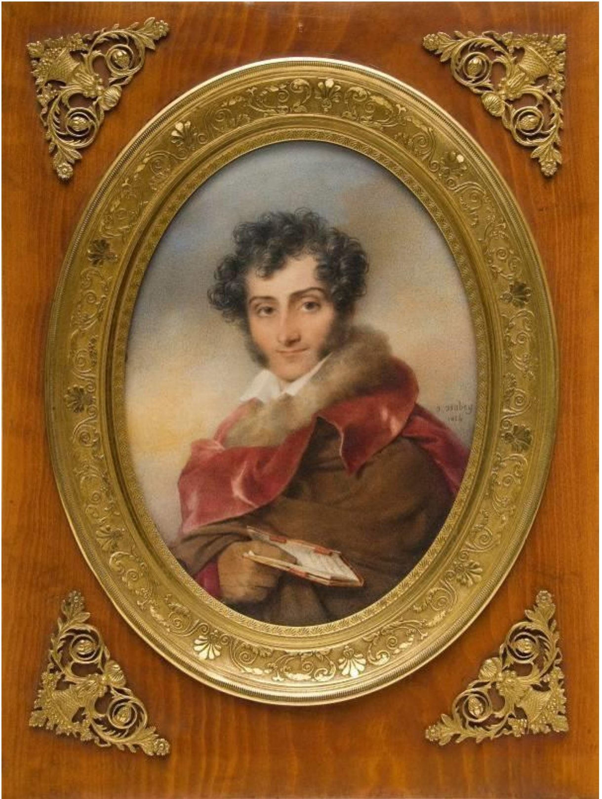
Acuarela sobre papel Francia, 1824 MNAD n°3510