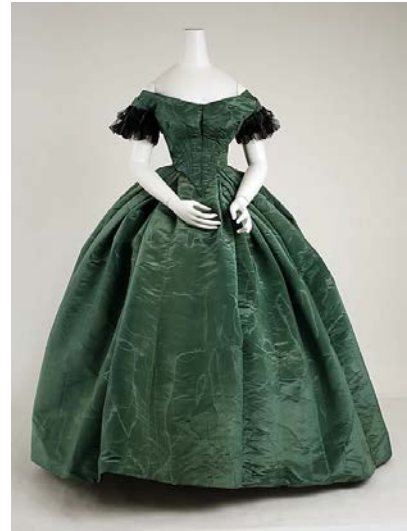
Vestido de cena. C. 1855 The Costume Institute, MetMuseum, Nueva York, EEUU