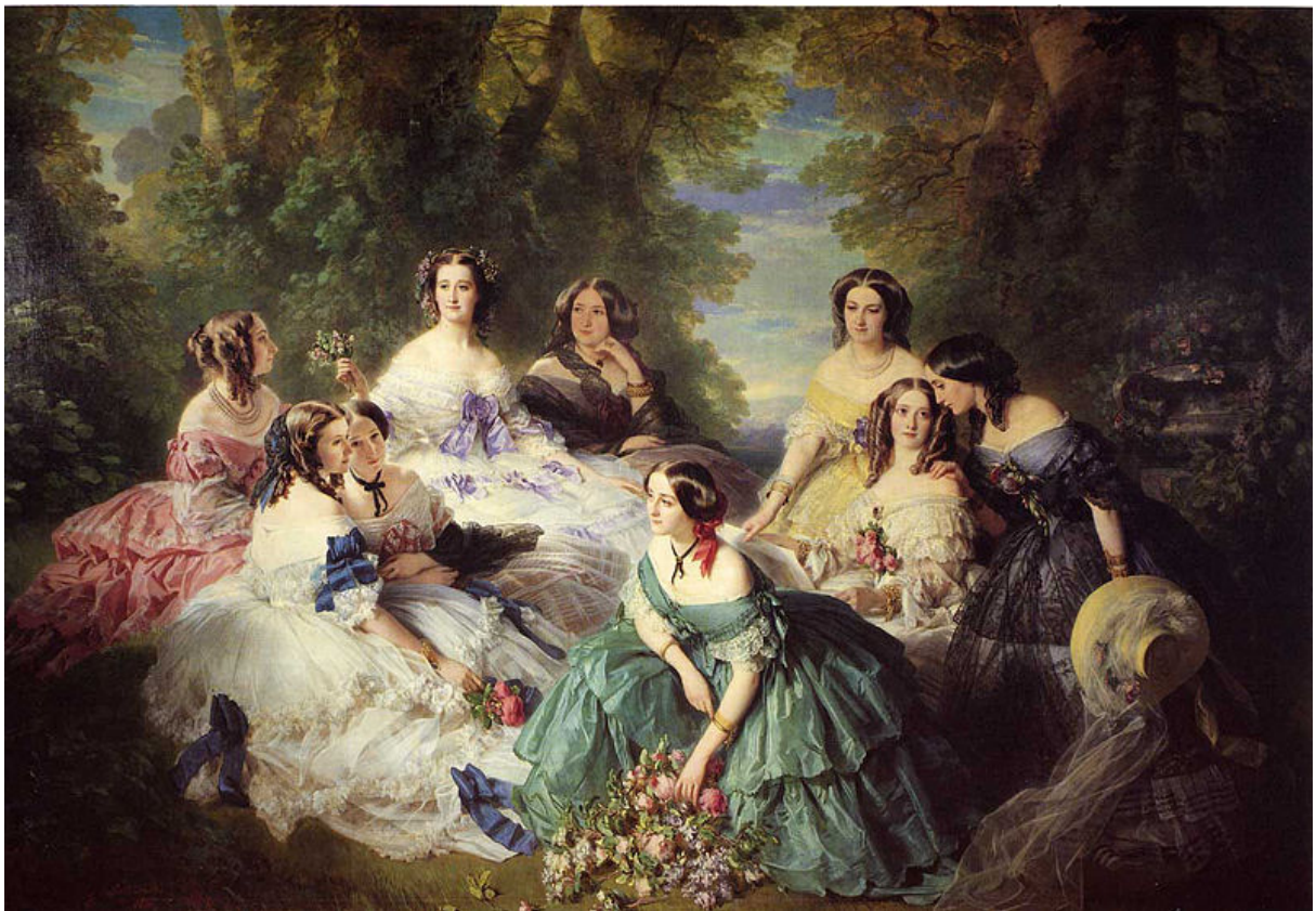
La emperatriz Eugenia rodeada de sus samas de compañía (1855), Franz Xaver Winterhalter, Château de Compiègne .