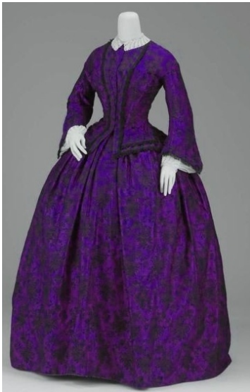
Vestido de día. Principios 1850 Museo de Bellas Artes de Boston, EEUU