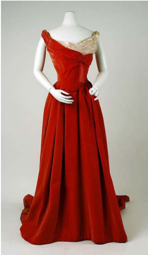
Vestido de noche Casa Worth - París C. 1898 – 1900 The Costume Institute – MetMuseum, NYC