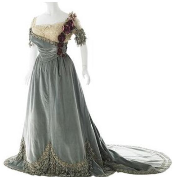
Vestido de baile Casa Worth – París C. 1905 The Costume Institute – MetMuseum, NYC