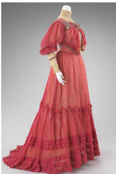
Vestido de tarde Diseñador: Jacques Doucet C. 1903

Destacando la saliente de la S en la cola, se utilizaba una variante de falda/enagua que enfatizaba la curvatura de la parte posterior. La ropa interior se hacía en lino, muselina algodón fino y poplín. Entre los textiles se usaron: lanas, sarga, cachemir, pelo de camello y paño fino para abrigos y prendas de calle. También raso y taffeta. Los materiales más populares entre la clase alta (también llamada alta burguesía) eran el terciopelo, raso, foulard, damascos y creppe de chine, todos de seda natural. Como decoración: bordados en hilos metálicos y multicolores, pasamanería, azabaches, mostacillas y pedrería en general. El rango de colores era muy amplio tomando los básicos: blanco, negro, azul, rosa claro, gris y rojo, a los que se sumaban variantes como el bordó, verde y marrón.