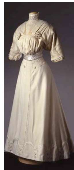
Vestido de paseo Atelier A La Ville de Lyon. C. 1905 – Palazzo Pitti